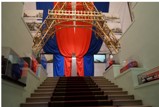
Главная лестница (Садовая, 50)

Мы будем рады помочь организовать ваше мероприятие в самом центре северной столицы.