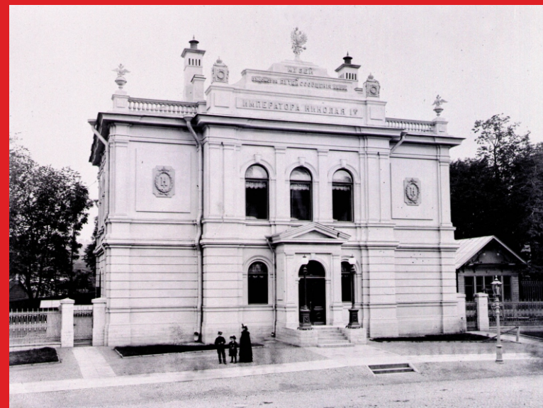
Основное здание музея (Садовая, 50) в год постройки. 1902 г.